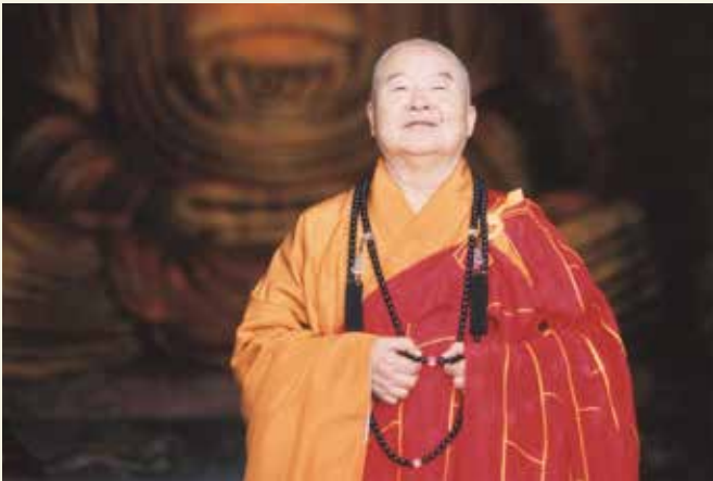
作者：佛光山開山星雲大師

這是一部非常複雜的《全集》，因為在我個人成長的九十年歲月中，於時上，經歷了北伐時期、土匪橫行、軍閥割據，以至抗戰、內戰、兩岸對峙等時期；於地理上，我走遍世界五大洲，幾乎平均每年環繞地球一、二次；於人事上，上至國王大臣，下至販夫走卒，我一概平等對待，視為朋友。尤其在我一生的時光之中，於佛教裡，凡事不推諉，舉凡弘法建寺、安僧辦道、創辦學校、成立協會、養老育幼、救濟孤苦、社會服務等，皆盡力而為。也因此，成就了我多元的人生。